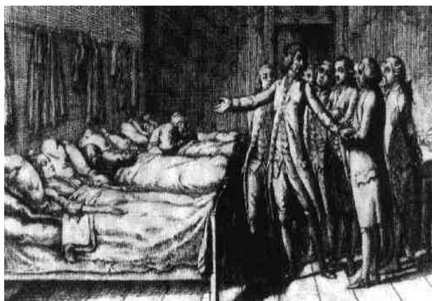
D. Chodowiecki: Visite in der Charité (1782)