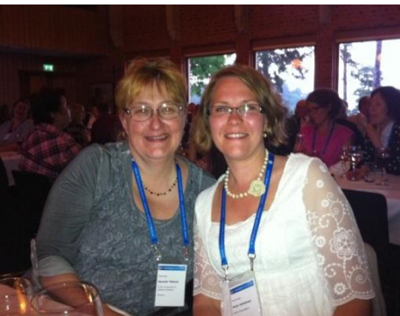
Gala-illallisella tutustuin turkulaiseen kollegaani