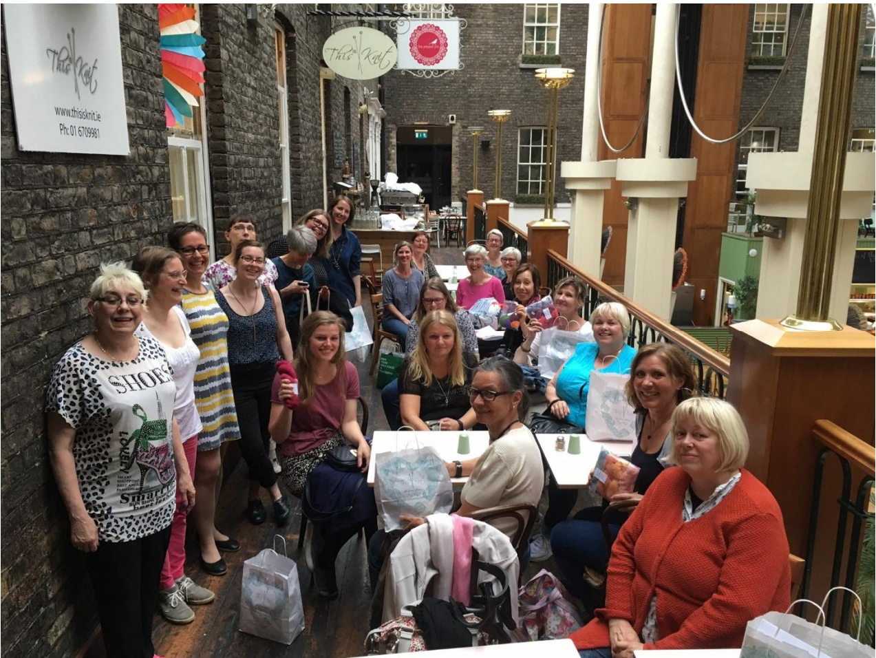
Iloista lankamaisteluporukkaa J

EAHIL-kollegat olivat järjestäneet Yarn Tasting -tapahtuman paikallisessa lankakaupassa! Oli todella innostava ilta, jossa saimme mukaan paljon tietoa, innostusta sekä omat lankamaistiaiset. Omanikin pitkään levossa ollut neulomisharrastukseni heräsi eloon illan ansiosta!