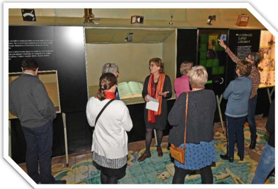
Ensimmäisen kokouspäivän lounastauon yhteydessä vierailimme Istituto superiore di sanità museossa.

Kävimme läpi ns. vuosikellon eli kaksivuotiskausien eri kuukausille vuosittain ajoitetut tehtävät ja teimme joitakin muutoksia ja lisäyksiä. Hallituksen tiedostot ovat jaetussa maksuttomassa Dropboxissa, joka alkaa täyttyä, joten päätimme hankkia maksua vastaan lisää tilaa tiedostoillemme.