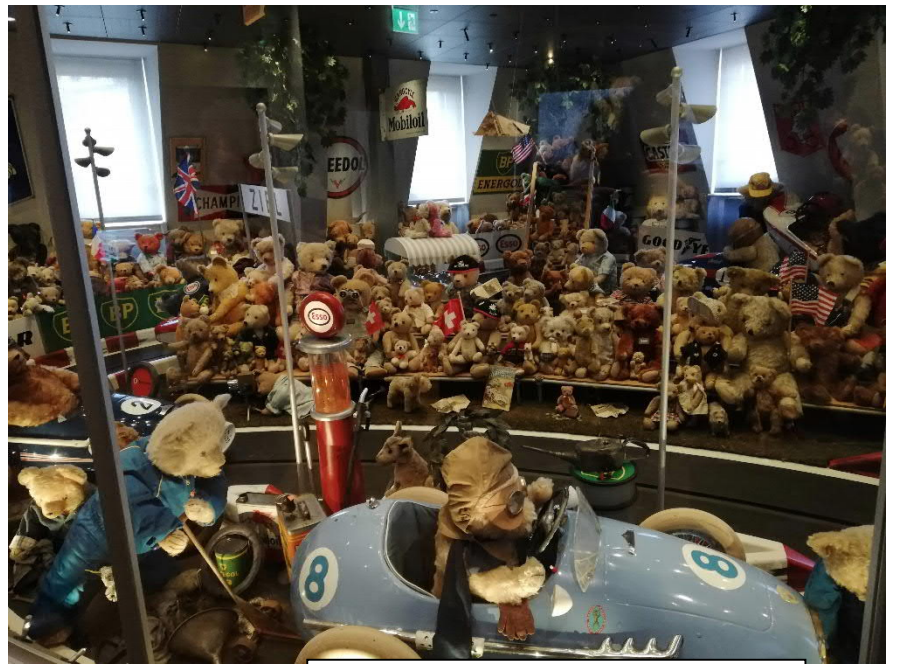
Baselin leikkikalumuseon nallet kilpa-ajossa 😊